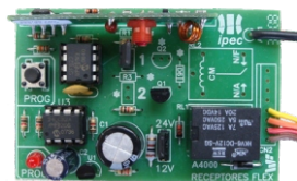
Código Prod: A4000/MONO